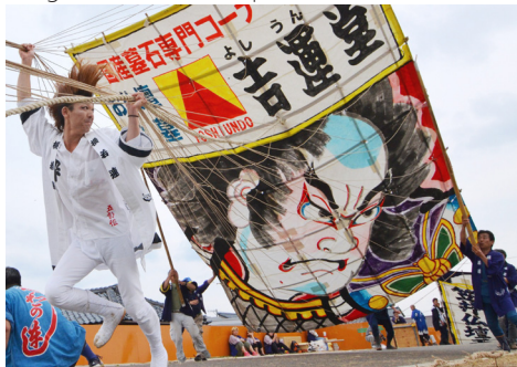
Shirone giant kite

14h Danse Ichiyama commentée avec les Geigi de NIIGATA (Japon)