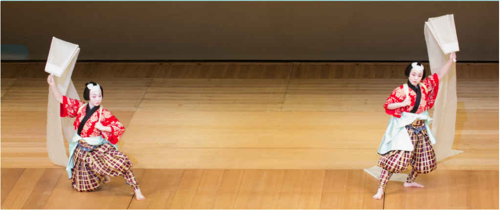
Ichiyama dance Niigata