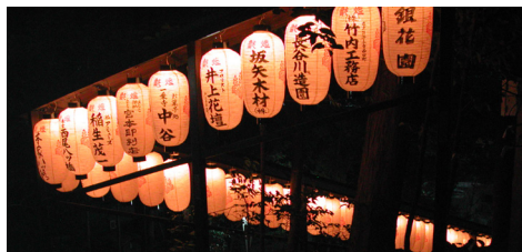
Lanternes dans la montagne KYOTO

18h30 - 21h30. Le jardin s'anime avec les lanternes des Marchands de SABLE et les Taigurumas de NIIGATA. Restauration japonaise avec les ateliers Kinoka (payant).